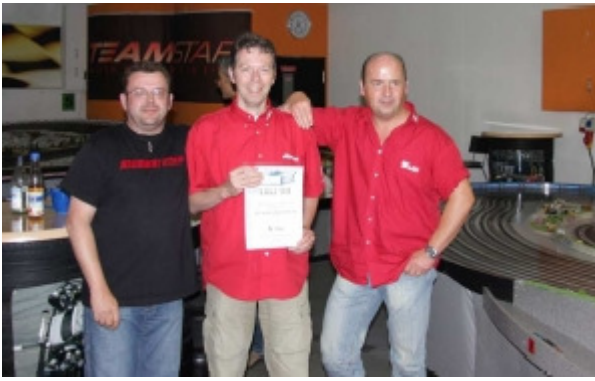
Platz 6 Team Scuderia Filderstadt