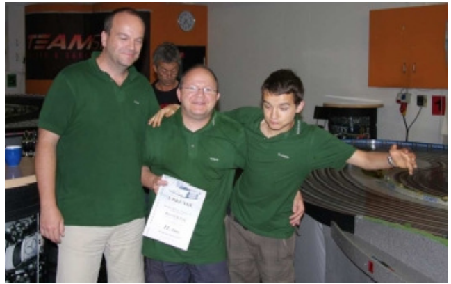
Team 11 Team Racing is Life