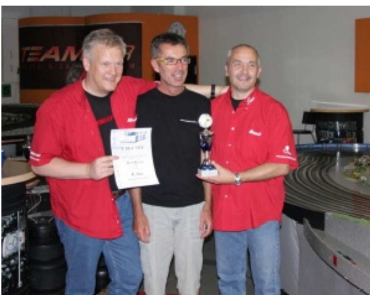
Platz 4 Team Bear Racing