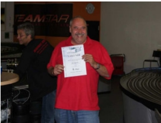
Platz 8 Team SG Stern