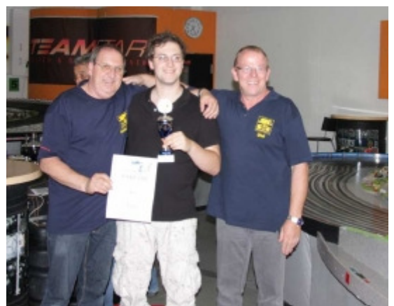
Platz 5 Team Knax