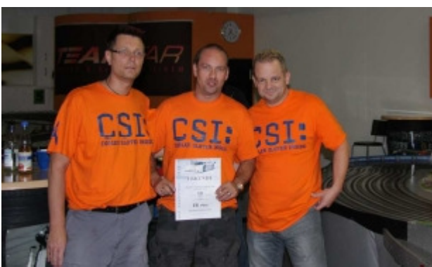
Platz 10 Team CSI