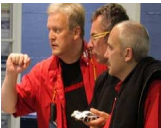
Die „Bären“ auf Platz 4