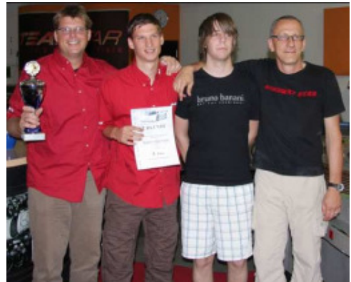
Platz 1 Team Perfect Strangers