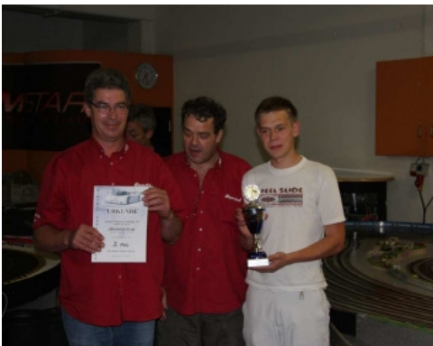
Platz 2 Team Highway Star