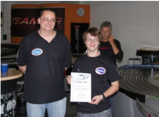
Team 12 Team Blue In