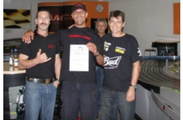
Platz 7 Team SCRC Filstal-Barbaren