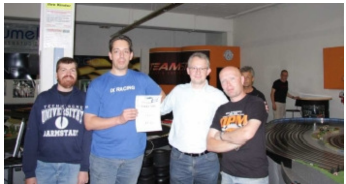
Team 13 Team iX-Racing