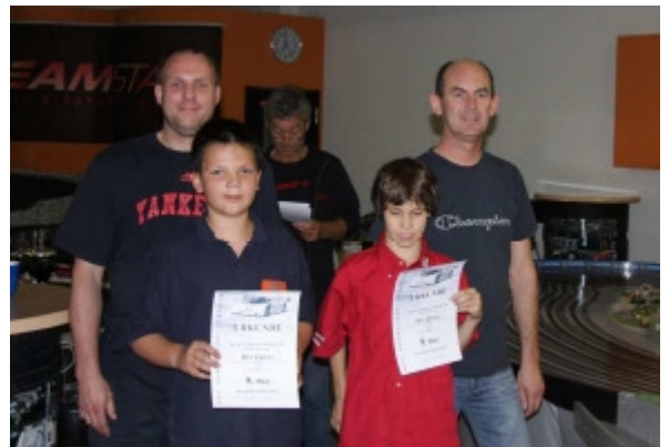
Platz 9 Team Hot Chili