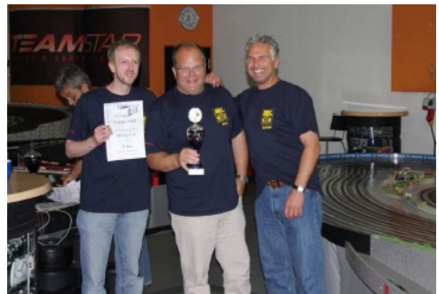
Platz 3 Team SRC Stuttgart